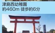
津島神社 約500m 徒歩約7分