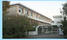
津島市立西小学校 約400m 徒歩約5分