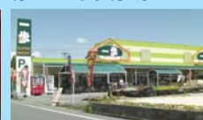
スーパー歩 約300m 徒歩約4分