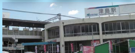
津島駅 自転車約8分