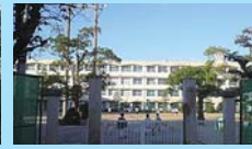
津島市立天王中学校 約580m 徒歩約8分